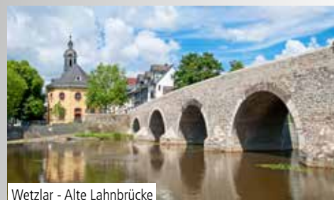
Wetzlar - Alte Lahnbrücke